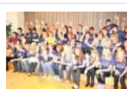
Zum großen Abschlussfest trafen sich Schüler aus Kaluga und Suhl in der Aula des Gymnasiums. Foto: frankphoto.de Bild: