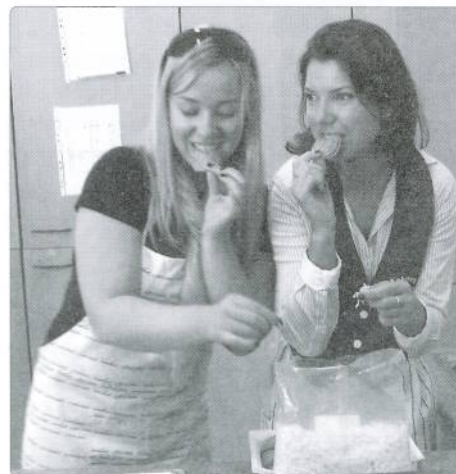
Vorkosten bei der Zubereitung der Pizzen