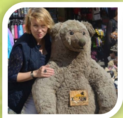
Elena Deutsch-Russisches Begegnungszentrum