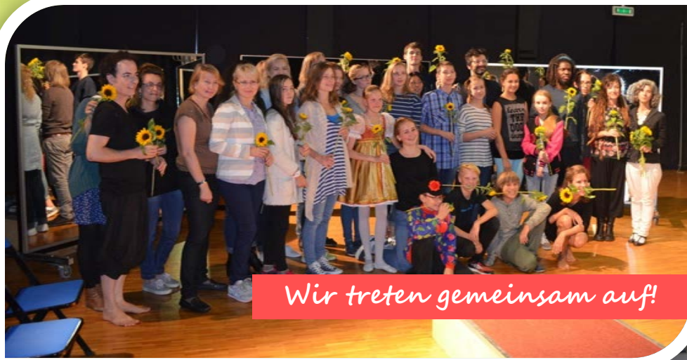
Wir treten gemeinsam auf!