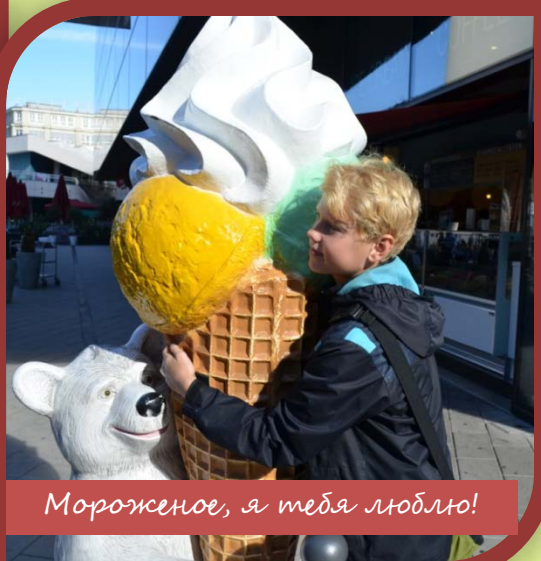
Мороженое, я тебя люблю!