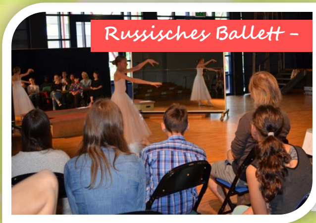
Russisches Ballett -