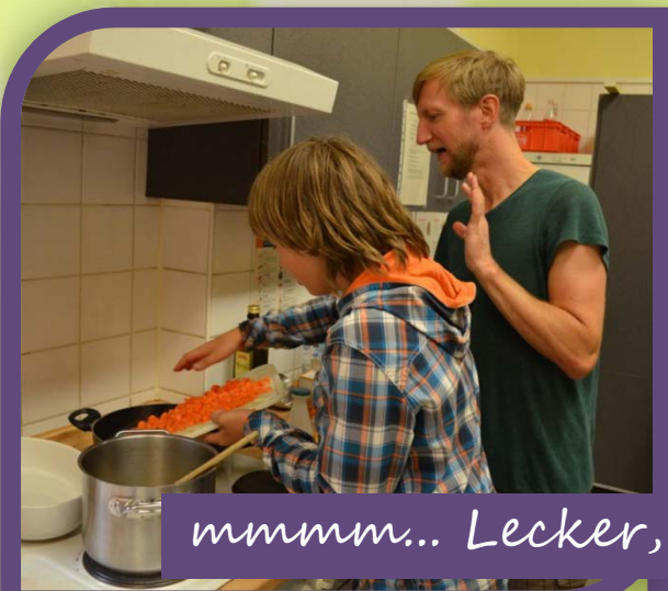
mmmm... Lecker, lecker