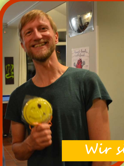
Wir sind satt und glücklich