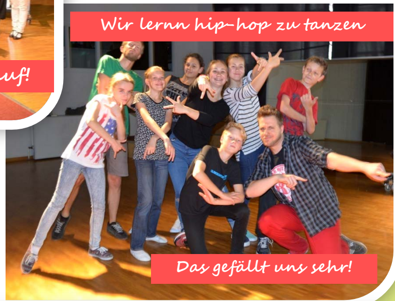
Wir lernen hip-hop zu tanzen