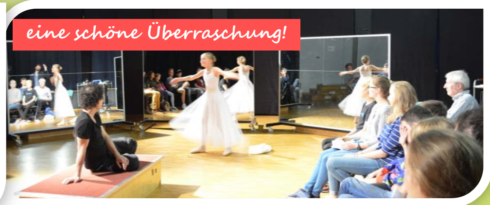
eine schöne Überraschung!