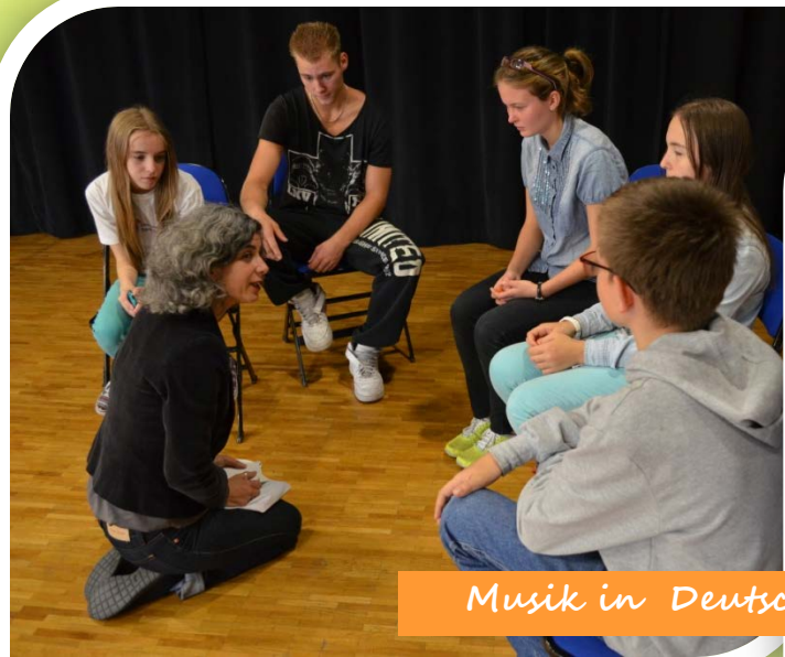
Musik in Deutschland und Russland