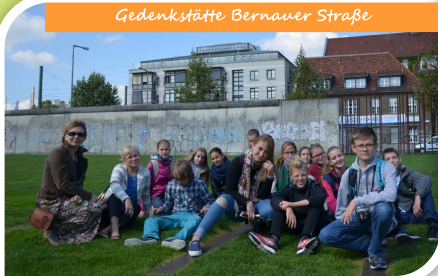
Gedenkstätte Bernauer Straße