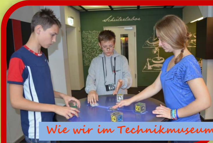
Wie wir im Technikmuseum experimentieren